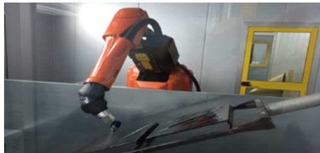
Ein Lackierroboter beschichtet die Bauteile in der innovativen Lackieranlage.

Durch die Anwendung des innovativen Verfahrens auf größere Bauteile werden zum Teil völlig neue Anwendungsmöglichkeiten wie Zierleisten, Kühlergrills, Beschläge und Leuchten erschlossen.